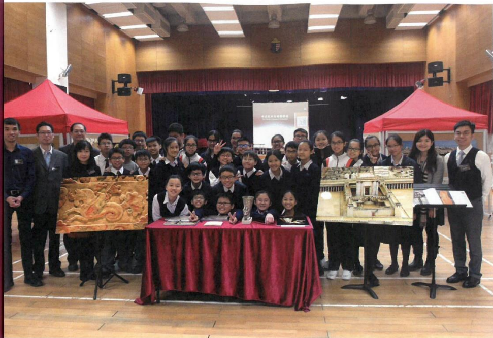
● 學校將禮堂變成小型博物館，展出與歷史課題相關的照片。

2016/17 學年，學校將 QSHK 計劃融入學科，突破了現實的緊箍咒，實現了不可能的任務。