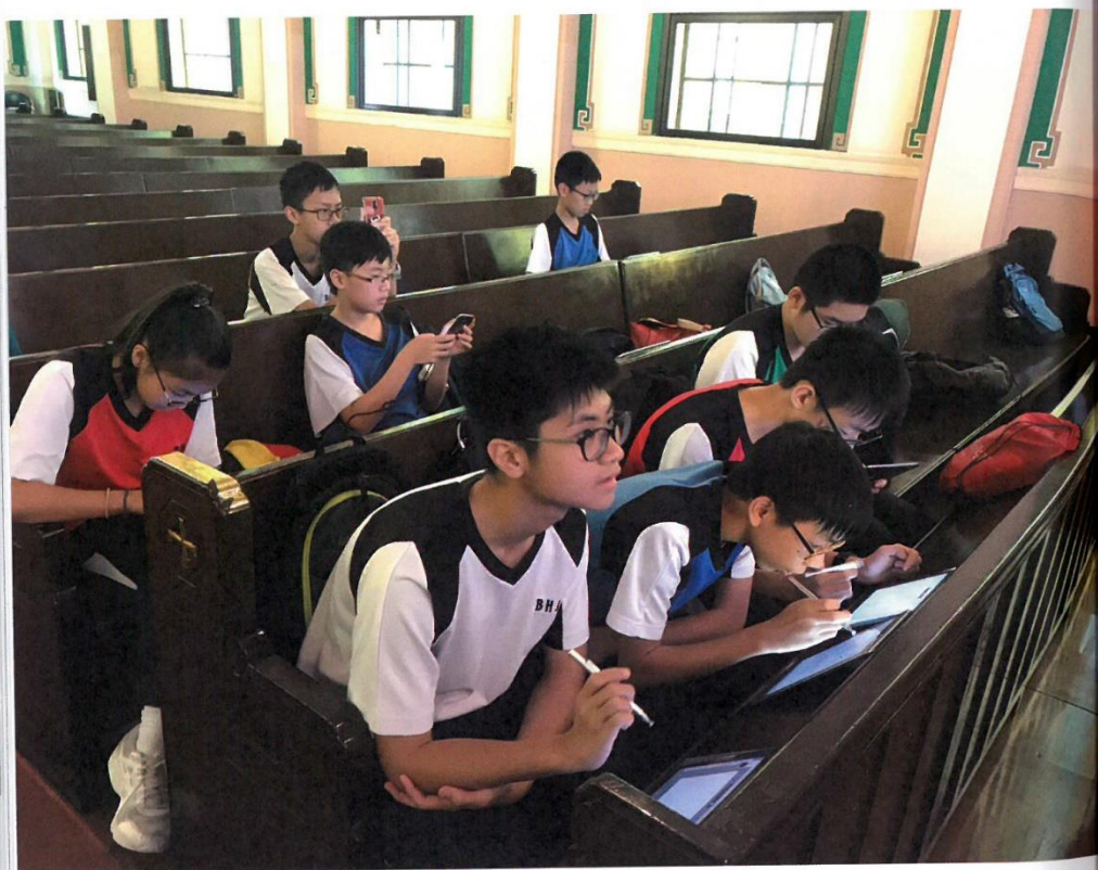
● 藉着帶領學生出外考察，擴闊他們的視野，提升學習成效。

「人學習，僅有聆聽並不足夠，要見，見識見識，見到就識。我們一直以為藝術、資訊科技等元素與學科各不相干，卻原來在許多層面也可相輔相成。」校長王莉莉總結，要推動學校進行改變並不容易，但只要大家肯踏出第一步，其後的發展就會像齒輪般自動滾動。「學校、老師、學生，大家唇齒相依，一個變，其他也會跟着變。最初當然由老師做起，老師踏前一步，學生就會跟着走前一步，老師看到學生好，自然會再向前邁出一大步，這樣學校也就跟着動起來，就如小齒輪帶動大齒輪轉動再推動小齒輪翻滾，如此循環不息。難得老師肯改變，我們便應給予空間與資源支持。」