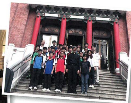
● 同學參觀的聖約翰座堂（左）及聖馬利亞堂。